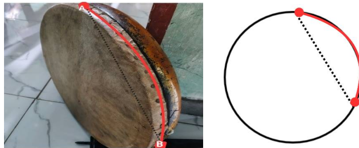
Gambar 2. Paku pada Tepi Rawana Memuat Konsep Busur dan Tali Busur

Pada bagian tepi rawana , terdapat paku-paku kecil yang dipasang secara melingkar untuk mengencangkan kulit kambing pada rangka kayu. Paku-paku tersebut tersebar sepanjang keliling bingkai kayu dengan jarak yang relatif sama, satu sama lain. Susunan paku ini secara tidak langsung memvisualisasikan konsep busur dan tali busur dalam geometri lingkaran.