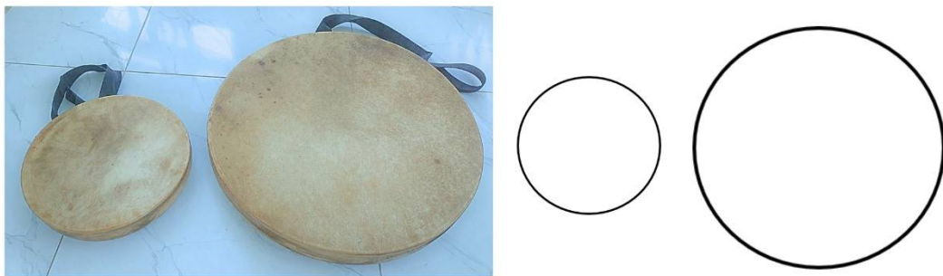
Gambar 4. Dua Unit Rawana dengan Ukuran Berbeda

Hasil observasi menemukan adanya rawana dengan ukuran yang berbeda, yaitu ukuran besar (diameter sekitar 60 cm) dan satu unit berukuran lebih kecil. Meskipun ukurannya berbeda, keduanya tetap memiliki permukaan berbentuk lingkaran. Secara matematis, dua lingkaran selalu memenuhi syarat kesebangunan karena memiliki bentuk yang identik dengan perbandingan ukuran yang proporsional. Nilai pedagogis temuan ini bukan pada fakta bahwa dua lingkaran itu sebangun, melainkan pada potensi rawana sebagai media konkret yang memungkinkan peserta didik mengamati dan memverifikasi langsung konsep kesebangunan dalam konteks budaya lokal, termasuk membandingkan jari-jari, keliling, dan luas dua rawana berbeda ukuran secara nyata. Dalam konteks etnomatematika, hal ini menunjukkan bahwa konsep geometri hadir secara intuitif dalam proses pembuatan rawana oleh masyarakat Mandar.