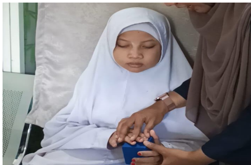
Gambar 1. Guru membantu peserta didik meraba benda konkret

Pada pembelajaran inti, peserta didik meraba alat peraga atau media yang berbentuk bangun ruang. Guru mengajukan pertanyaan kepada peserta didik mengenai nama bangun yang diraba. Selanjutnya guru menyampaikan materi dengan cara memberikan arahan kepada peserta didik untuk meraba bagian-bagian dari benda konkret yang dipegang. Guru membantu peserta didik untuk meraba media benda konkret dan mengarahkan tangannya guna mengetahui letak sisi, rusuk, dan titik sudut dari bangun kubus, balok dan tabung. Selain memberi penjelasan dan menunjukkan letak sifat bangun ruang tersebut, guru juga mengajak peserta didik untuk ikut menentukan banyak sisi, rusuk dan titik sudut disetiap bangun ruang.