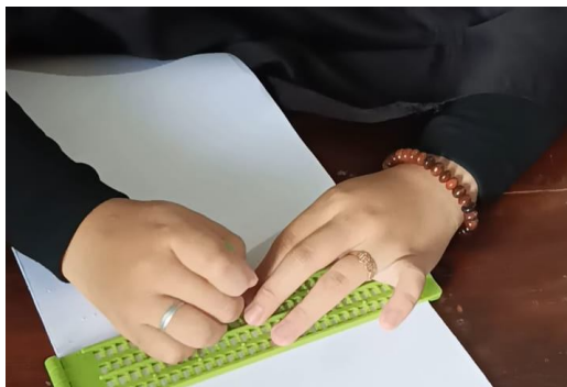
Gambar 3. Peserta didik mencatat materi dengan tulisan Braille

Setelah selesai menyampaikan materi sifat-sifat bangun ruang, guru memberikan kesempatan kepada peserta didik untuk mencatat materi yang telah dipelajari menggunakan tulisan Braille. Guru berkeliling melihat aktivitas peserta didik pada saat menulis catatan.