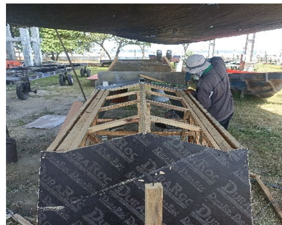
Gambar 3. Proses Penutupan Kerangka Menggunakan Triplek Duraroc