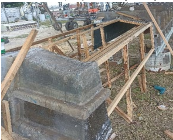
Gambar 2. Proses Pembuatan Kerangka Cetakan

menggunakan triplek duraroc yang dipasang dengan mengikuti kontur kerangka perahu dan dikencangkan menggunakan sekrup agar dapat melekat dengan kuat seperti Gambar 5. Permukaan cetakan kemudian dilakukan perataan permukaan dan sambungan dengan menggunakan flas CHPO putty (dempul) yang dicampur dengan CHPO cream (hardener), sehingga memperoleh permukaan cetakan yang rata dan siap untuk dilaminasi.