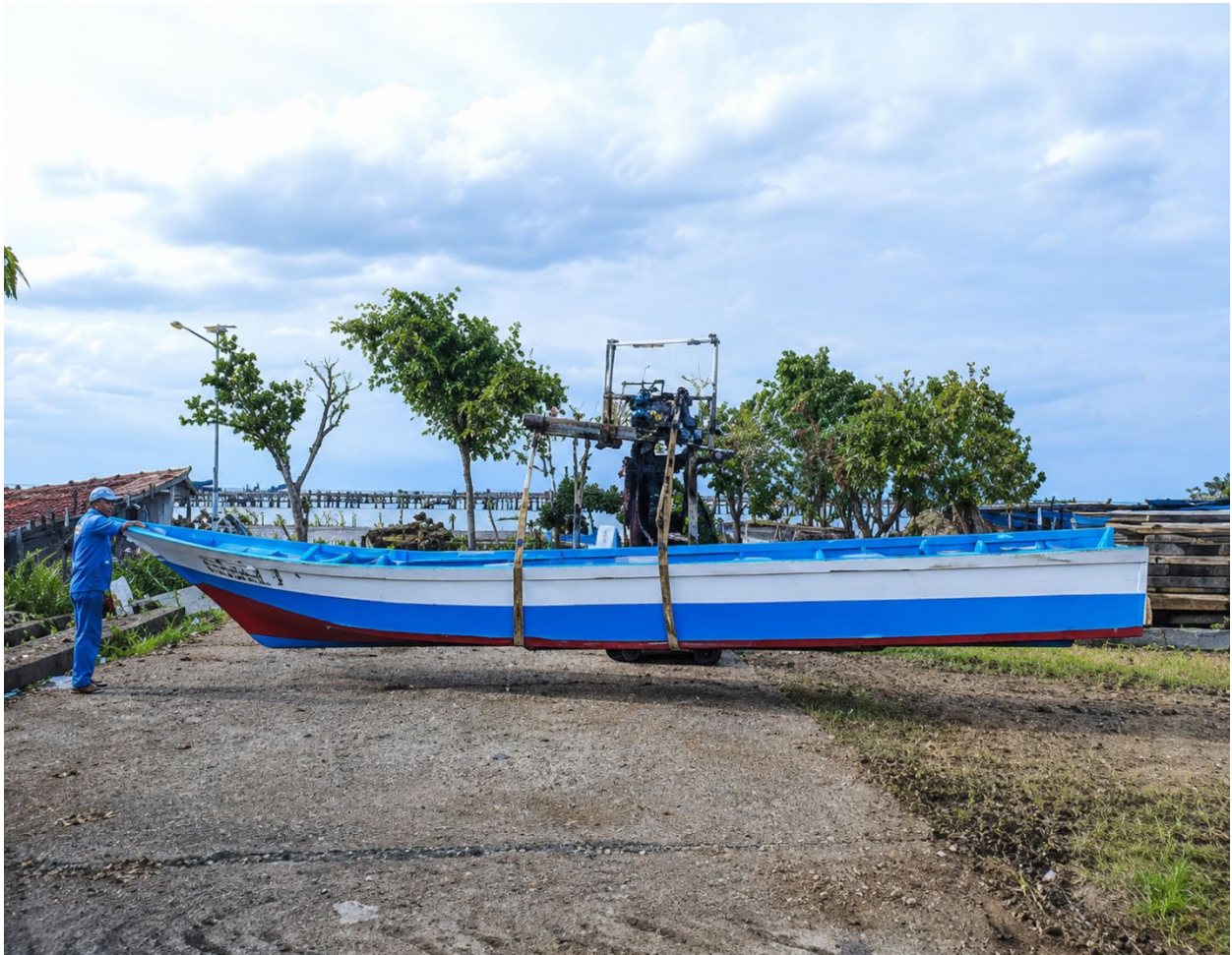
Gambar 10. Hasil Pembuatan Perahu Nelayan