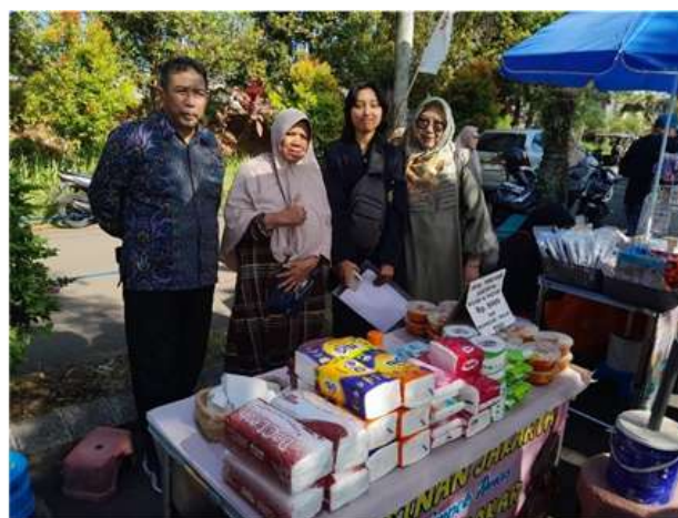
Gambar 1 Kegiatan Pendampingan

signifikan pada peserta. Mayoritas peserta mulai memisahkan keuangan pribadi dan usaha, meningkatkan pencatatan biaya produksi, serta menerapkan perhitungan harga jual yang lebih rasional. Perubahan ini merupakan indikator keberhasilan pendampingan yang mengarah pada peningkatan kemandirian usaha.