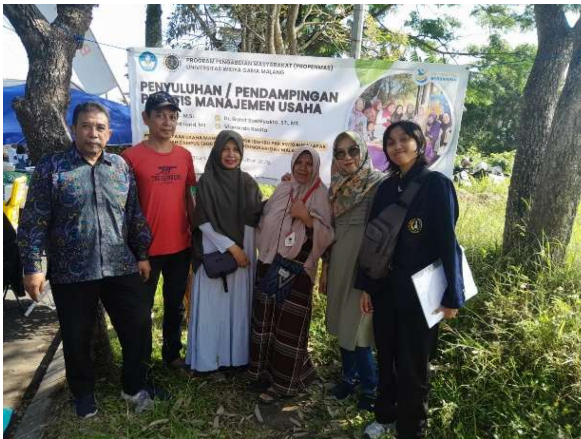
Gambar 2 Kolaborasi Kelompok PKK

Penelitian [7] menunjukkan bahwa kolaborasi kelompok dalam kegiatan pemberdayaan UMKM berbasis komunitas berpengaruh pada keberlanjutan usaha serta peningkatan motivasi anggota untuk terus belajar dan mengembangkan usaha. Temuan serupa terlihat pada kelompok PKK Desa Landungsari, di mana kolaborasi mempercepat proses adopsi praktik keuangan baru.