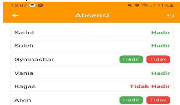
Gambar 8. Foto Tampilan Absensi Digital