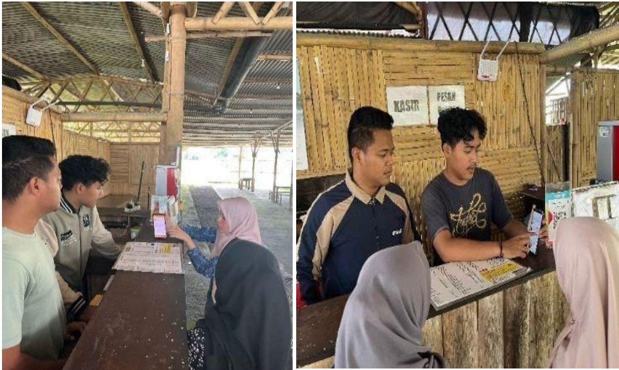
Gambar 6. Foto Pelatihan Kepada Kasir Kafe

Kegiatan pelatihan penggunaan aplikasi financial technology kepada pemilik dan karyawan dilakukan secara langsung oleh tim pengabdian. Kegiatan tersebut dapat dilihat pada gambar berikut.