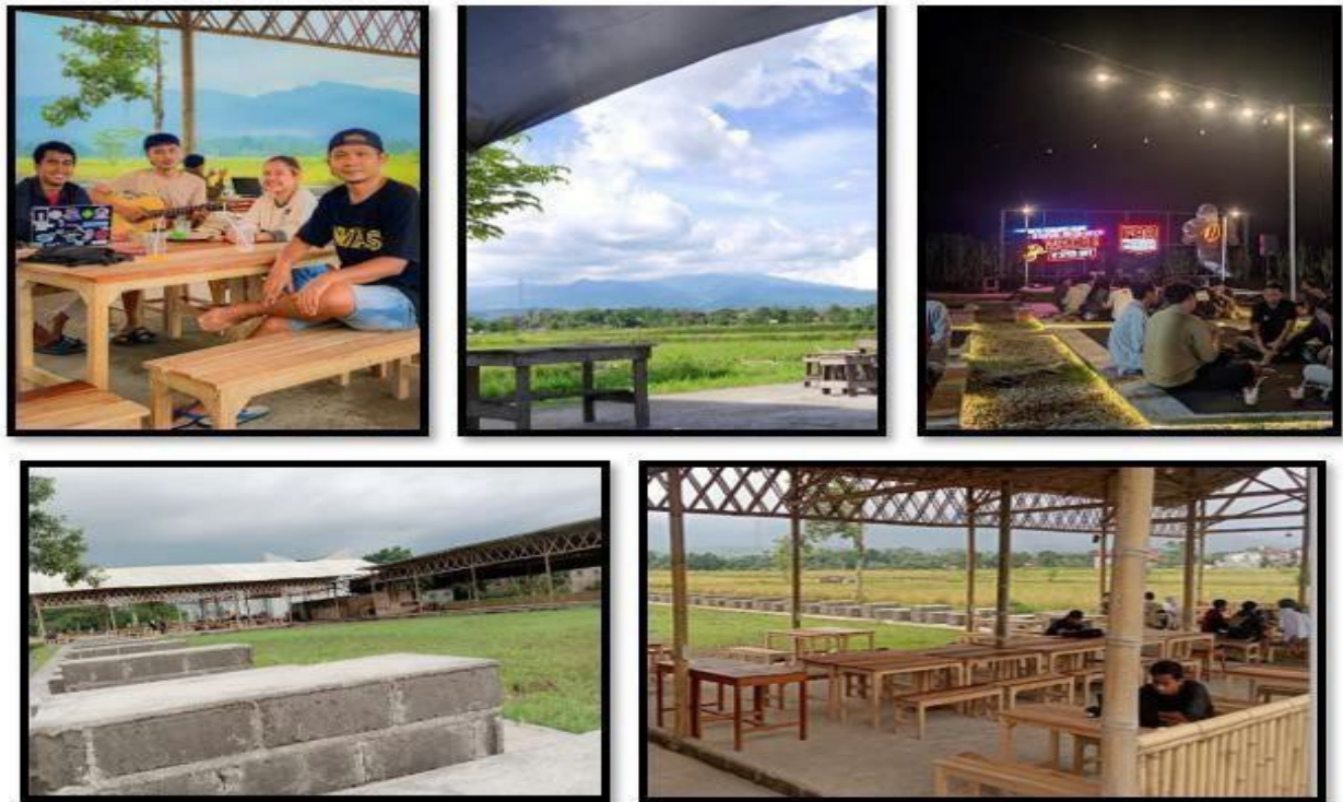
Gambar 3. Unit Usaha Mitra

keuangan belum terintegrasi dengan pemilik usaha sehingga laporan tidak dapat diakses secara langsung. Selain itu, sistem absensi karyawan masih dilakukan secara manual melalui pengiriman foto pada grup WhatsApp yang berpotensi menimbulkan kesalahan pencatatan maupun manipulasi data [11]. Kondisi tersebut menunjukkan perlunya penerapan sistem pengelolaan usaha berbasis digital agar manajemen usaha dapat berjalan lebih efektif [12].