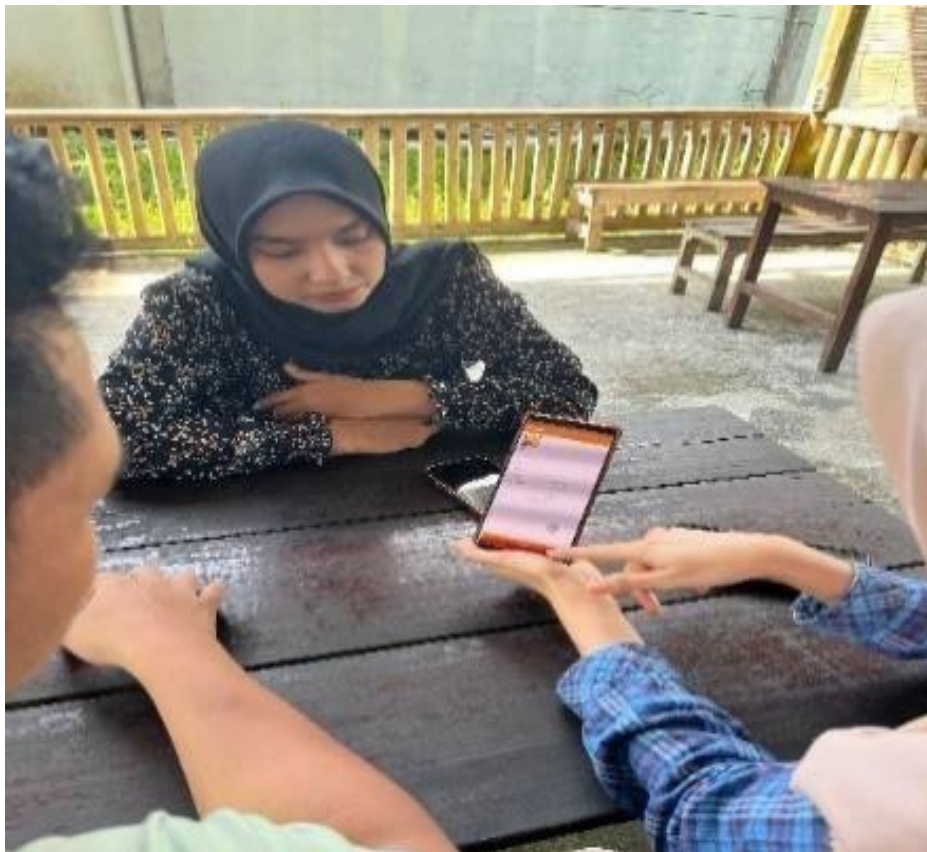
Gambar 5. Foto Pelatihan Kepada Pemilik Kafe

sekitar 90%. Selain itu, waktu pencatatan transaksi menjadi lebih cepat dan kesalahan laporan absensi dapat berkurang. Hasil tersebut menunjukkan bahwa penerapan sistem digital mampu meningkatkan efisiensi dan transparansi dalam pengelolaan usaha.