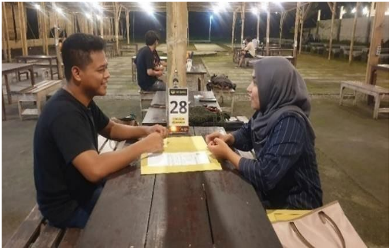
Gambar 1. Survei Mitra

di atas, maka tim pengabdian akan memberikan pelatihan layanan keuangan dengan aplikasi financial technology untuk meningkatkan kualitas pengelolaan keuangan pada Kafe Kopi Kampus Antirogo Kecamatan Sumpersari Kabupaten Jember.