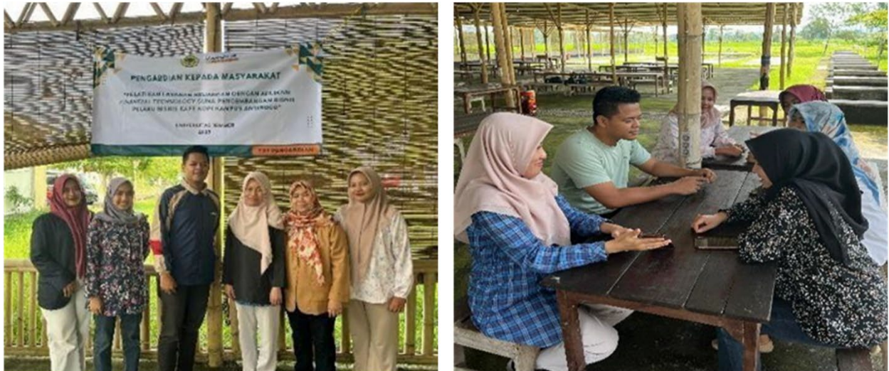
Gambar 4. Foto Sosialisasi dan FGD Pada Mitra

Pada tahap pasca-pelaksanaan dilakukan monitoring dan evaluasi terhadap penggunaan sistem selama satu bulan. Hasil evaluasi menunjukkan adanya peningkatan dalam pengelolaan usaha, di mana akurasi pencatatan keuangan meningkat dari sekitar 60% menjadi