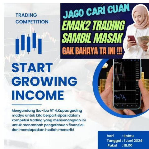
Gambar 1. Brosur Kegiatan Victory Trading Competition