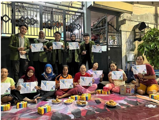
Gambar 2. Dokumentasi Kegiatan Victory Trading Competition