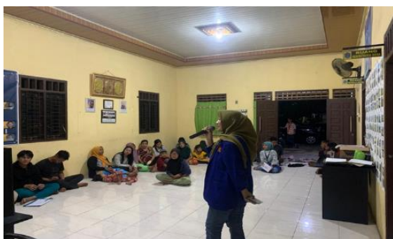
Gambar 2. Sosialisasi Pajak Desa

Susunan acara sosialisasi pajak desa Upaya meningkatkan pengetahuan (knowledge) dan kesadaran masyarakat membayar pajak penghasilan di Desa Simping Pelabuhan Dalam.