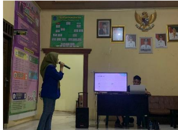
Gambar 1. Sosialisasi Pajak Desa

Kami akan memastikan bahwa wajib pajak mematuhi pemberitahuan ini. Itu tidak dikenakan pajak atau registrasi perdagangan dan monopoli serta kewajiban perpajakan atau ketentuan perpajakan lainnya [19].