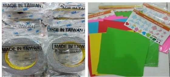
Gambar 2. Alat dan Bahan Kolase Origami

data, dan observasi sebelumnya di lapangan. Dalam aktivitas kolase, daya linguistik anak ditingkatkan, sehingga siswa terlatih untuk menerangkan dan menceritakan karya mereka kepada guru. Selain itu, aktivitas kolase seperti berkarya seni rupa yang ditunjukkan dengan merekatkan dan menyusun material yang diakomodasi dapat membantu anak meningkatkan perkembangan segi motorik halus. Eksplorasi juga membantu siswa dalam memahami benda untuk mempelajari sifatnya sampai ke tahap membuat keputusan tentang benda benda tertentu tanpa melakukan kontak langsung.