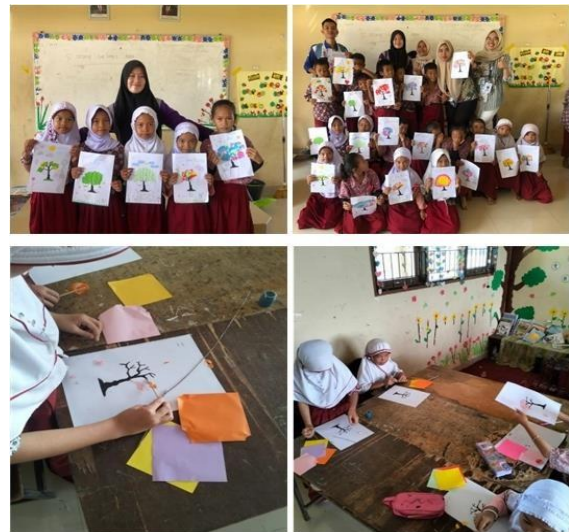
Gambar 3. Kegiatan Kolase

sesudah diberi perlakuan kegiatan kolase. Kondisi sebelum diberikan perlakuan terlihat bahwa perkembangan motorik halus anak belum sepenuhnya berkembang. Hal ini terlihat dalam kegiatan siswa tidak mengikuti instruksi dengan benar seperti menempelkan kertas dan siswa terlihat masih kaku dan bingung untuk berkreasi, memilih bahan yang ukurannya kecil, dan belum bisa memberi lem pada kertas pola kegiatan kolase secara rapi. Sedangkan kondisi setelah diberikan perlakuan melalui arahan terlihat bahwa siswa mampu mengikuti arahan dengan baik dan benar dan dapat mengikuti instruksi dan sesuai dengan harapan seperti rapi saat menempelkan lem, pemilihan warna yang kontras dan menghias bagian kertas yang masih kosong dengan imajinasi. Siswa terlihat senang dan bersemangat untuk melakukan kegiatan kolase setiap kali.