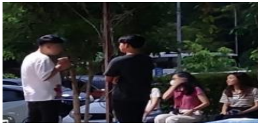
Gambar 1. Dokumentasi diskusi dengan pihak UMKM