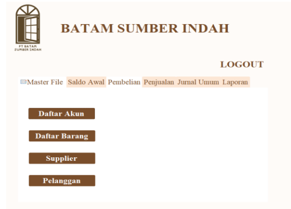
Gambar 3. Tampilan Menu Home Microsoft Office Access yang Dirancang