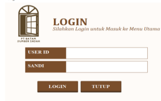
Gambar 1 Tampilan Sebelum Masuk ke Menu Utama (Home). Sumber: Data diolah (2023)

Untuk masuk ke Menu Utama (Home) terdapat tampilan Login yang akan muncul ketika sistem tersebut dijalankan. User ID dan sandi pengguna dapat lebih dari satu. Untuk menambah ID User dan Sandi dapat dilakukan dengan cara sebagai berikut.