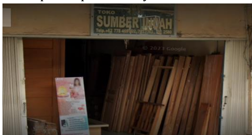
Gambar 2. Survei Lokasi UMKM

Pengabdikan melakukan survei lokasi di Jalan Laksamana Bintan No.9. dan juga melakukan wawancara dengan pemilik usaha dengan tujuan untuk memahami kendala pencatatan akuntansi yang dihadapi oleh pemilik usaha dalam proses pencatatannya.