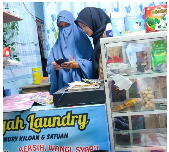
Gambar 4. Pelatihan Menggunakan Aplikasi Buku Kas