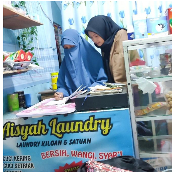
Gambar 3. Survei Pencatatan Manual

service-learning. Service-learning menggabungkan kegiatan akademis dengan pemberdayaan masyarakat, merangsang refleksi terhadap implementasi dalam masyarakat [15].