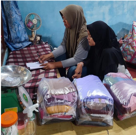
Gambar 5. Pelatihan Pencatatan Laporan Keuangan