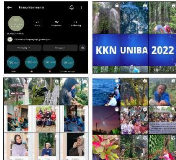
Gambar 5. Akun Sosial Media Instagram

Gambar 5 menunjukkan pembuatan akun media sosial Instagram Sumber Manis. Akun ini merupakan kegiatan mahasiswa selama KKN dalam menunjang promosi destinasi Wisata Alam Sumber Manis. Kegiatan meliputi perbaikan spot wisata, tangga, petunjuk arah, kegiatan PKK, pengajian warga Suko, profil kelompok KKN, pembuatan gapura, pelatihan obat-obatan bersama mahasiswa Universitas Jember, dan edu-camp . Selanjutnya, akun diberikan kepada pihak pengelola untuk update kegiatan yang sudah dilakukan setelah KKN selesai.