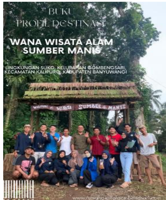
Gambar 6. Buku Profil Sumber Manis

Gambar 6 menjelaskan pendampingan dan pembuatan buku profil. Tujuan buku profil untuk mempermudah dan memperkenalkan wana wisata, spot foto, keunikan serta keunggulan Sumber Manis kepada pengunjung lokal, domestik atau mancanegara.