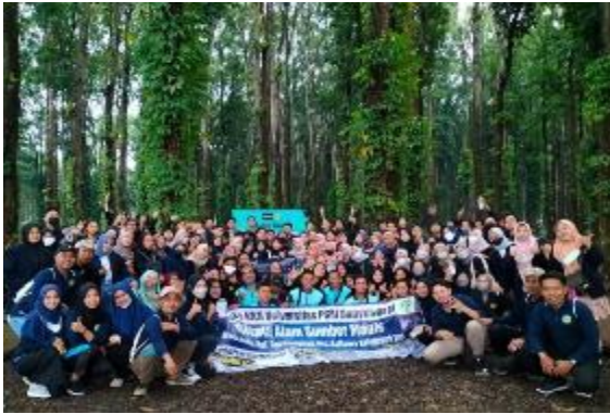
Gambar 3. KKN Universitas PGRI Banyuwangi

promosi secara berkala baik media sosial atau website .