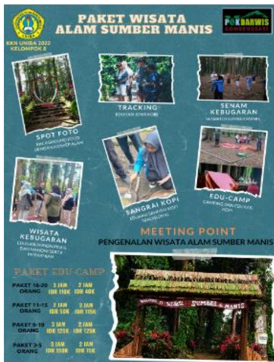
Gambar 7. Paket Wisata

Pengunjung wisata yang berkunjung di Wisata Alam Sumber Manis dari bulan Juli-Agustus meningkat 20%. Hal ini dibuktikan dengan jumlah pengunjung di hari sabtu dan minggu sebesar \pm 20 pengunjung.