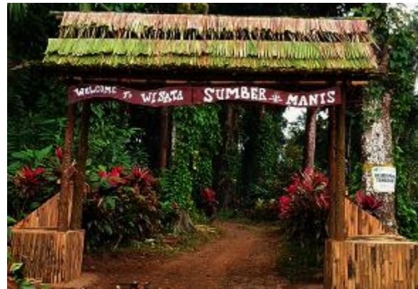
Gambar 1. Destinasi Wisata Alam Sumber Manis

Wisata Alam Sumber Manis merupakan salah satu destinasi alam yang berlokasi 12 kilometer dari kota Banyuwangi dengan ketinggian \pm 650 Mdpl, suhu 23-30°C, dan curah hujan 2.088 mm [25]. Sumber Manis diambil dari nama “Sumber” yang dipercaya oleh masyarakat memberikan keistimewaan pada saat berkunjung. Wisata didirikan tahun 2017 dengan memodifikasi hutan belantara menjadi objek wisata yang menarik untuk menikmati suasana alam sejuk bersama keluarga yang ditunjukkan gambar 1 [24].