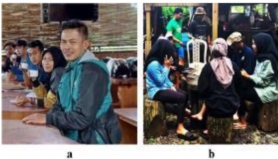
Gambar 4. Koordinasi (a) dan Pendampingan (b)

Mengacu permasalahan pengelola destinasi wisata, maka dosen dan mahasiswa UNIBA melakukan koordinasi awal terkait kebutuhan branding destinasi, kemudian pendampingan dalam pembuatan buku profil dan akun media sosial Instagram.