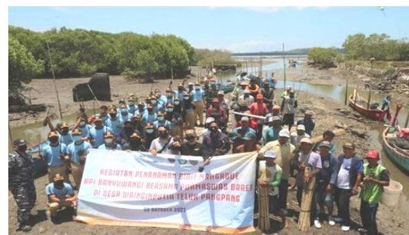
Gambar 2 Dokumentasi kegiatan penanaman Mangrove dan pemberian edukasi pada masyarakat nelayan.

Kegiatan dimulai dengan arahan dari Direktur API Banyuwangi serta perwakilan stakeholder yang turut hadir bersama dalam kegiatan ini. Kegiatan