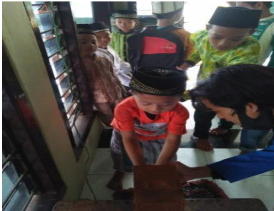
Gambar 3. Keterlibatan mitra dalam sosialisasi hand sanitizer otomatis

Pada masa pandemic Covid 19 membersihkan tangan sangat penting karena tangan merupakan media masuknya kuman dan bakteri dari luar kedalam tubuh. Kebiasaan membersihkan tangan setiap habis melakukan kontak dengan teman, memegang barang, bermain di luar rumah dan sebagainya. Meski tak tampak kotor nyatanya tangan mengandung bakteri, karena ketersediaan hand sanitizer sebelum makan atau melakukan sesuatu yang kontak langsung dengan tubuh harus selalu dibiasakan. Selain pemberian hand sanitizer otomatis, sosialisasi tentang penggunaan alat dan pentingnya menjaga kebersihan tangan selama masa pandemi juga dilakukan. Penjelasan secara singkat tentang pentingnya kebersihan guna mencegah penularan Covid-19. Masyarakat dianjurkan selalu mencuci tangan setelah selesai beraktivitas di luar ruangan. Penggunaan hand sanitizer dapat dilakukan sebagai alternatif jika tidak dapat mencuci tangan secara langsung.