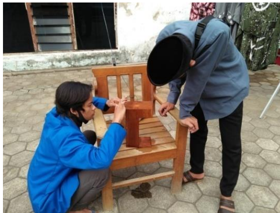
Gambar 2. Tahap persiapan sosialisasi hand sanitizer otomatis

Keberhasilan pelaksanaan PKM dilihat dari keberhasilan para siswa TPQ Darussalam menerapkan protokol kesehatan selama masa belajar di TPQ. Kegiatan sosialisasi tentang Covid-19 dan penggunaan alat hand sanitizer otomatis terhadap pengurus dan anak-anak yang menjadi sasaran PKM di TPQ Darussalam berjalan dengan lancar tanpa ada kendala. Anak-anak yang menjadi sasaran program merespon baik dan juga kooperatif terhadap kegiatan yang dilaksanakan.