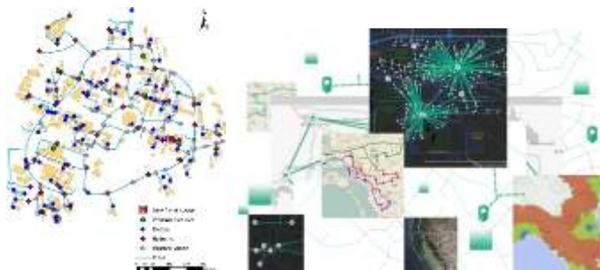
Gambar 2. Network Analysis

Tahap berikutnya adalah ekstraksi data koordinat geografis seluruh titik permintaan dan alternatif lokasi gudang ke dalam perangkat lunak GIS (ArcGIS/QGIS). Proses ini meliputi geocoding , validasi koordinat, serta network analysis berdasarkan peta jaringan jalan aktual.