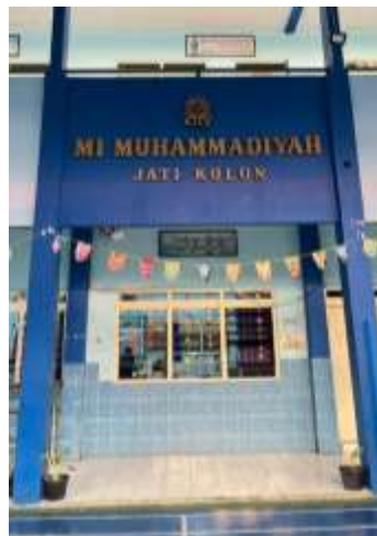
Gambar 1. Tempat TPQ Aisyiyah Kudus

rumah ke rumah, di mana para pengurus dan guru mengajar secara sukarela tanpa memungut biaya. Kegiatan ini bertujuan untuk menanamkan kecintaan terhadap Al-Qur'an sejak usia dini dan memberantas buta huruf Al-Qur'an di kalangan anak-anak. Seiring berjalannya waktu, jumlah peserta didik yang belajar semakin banyak sehingga dibutuhkan tempat yang lebih kondusif. Oleh karena itu, kegiatan TPQ kemudian dipindahkan ke MI Muhammadiyah Jati Kulon, yang masih berada dalam naungan Yayasan Aisyiyah. Pindahan ini dilakukan agar proses pembelajaran lebih efektif dan terorganisir. Hingga saat ini, TPQ Aisyiyah masih menggunakan ruang kelas MI Muhammadiyah sebagai tempat belajar pada sore hari, karena belum memiliki bangunan sendiri. Kondisi ini menjadi tantangan tersendiri dalam pengelolaan kegiatan, sebab penggunaan ruang harus disesuaikan dengan aktivitas sekolah pagi.