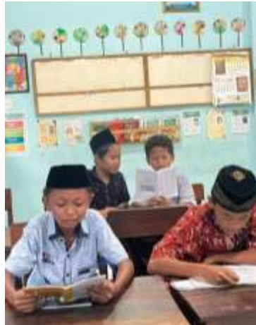
Gambar 2. Kegiatan mengaji jilid yanbu'a TPQ Aisyiyah Kudus

Berdasarkan hasil wawancara dan observasi yang dilakukan peneliti di TPQ Aisyiyah Jati Kulon Kudus, pada setiap awal kegiatan, guru membuka pembelajaran dengan mengucapkan salam kepada seluruh peserta didik sebagai bentuk pembiasaan adab sopan santun dalam Islam. Setelah itu, kegiatan dilanjutkan dengan pembacaan surah Al-Fatihah bersama-sama sebagai doa pembuka agar proses belajar mengaji senantiasa mendapat keberkahan dari Allah SWT. Selanjutnya, para peserta didik melantunkan Asmaul Husna secara bersama-sama dengan penuh semangat dan penghayatan, diiringi arahan dari guru agar anak-anak memahami makna dari setiap nama-nama Allah yang agung. Setelah kegiatan pembuka selesai, guru memulai inti pembelajaran.