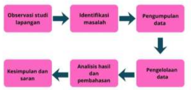
Bagan 1. Bagan Alur Observasi

melengkapi dan memperkuat temuan penelitian. Data yang diperoleh selanjutnya dianalisis secara kualitatif untuk menafsirkan dan menarik kesimpulan sehingga menghasilkan pemahaman yang mendalam dan sesuai dengan kondisi serta pengalaman pembelajaran di TPQ Aisyiyah Jati Kulon Kudus.