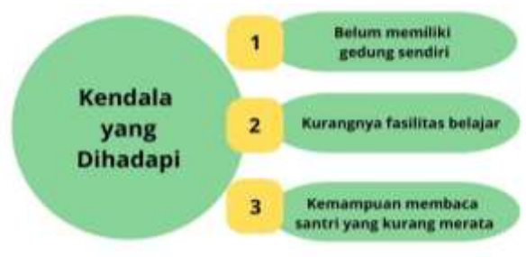
Bagan 3. Permasalahan yang dihadapi

keagamaan serta sosial seperti peringatan Hari Besar Islam, Maulid Nabi, Isra' Mi'raj, serta penyambutan bulan Ramadhan sebagai sarana mempererat silaturahmi guru, santri, serta masyarakat. Partisipasi TPQ Aisyiyah tampak pula melalui keikutsertaan pawai bersama 17 TPQ Aisyiyah se-Kabupaten Kudus memakai odong-odong hias bertema Islami, serta kirab Ramadhan di lingkungan MI Muhammadiyah sebagai bentuk syiar Islam di tengah masyarakat. Ragam kegiatan tersebut mencerminkan semangat kebersamaan, gotong royong, serta kecintaan terhadap nilai-nilai Islam sebagai bagian budaya lokal masyarakat Kudus. Dukungan masyarakat serta semangat guru mendorong TPQ Aisyiyah terus berkembang menjadi lembaga pendidikan Al-Qur'an berperan menanamkan kemampuan membaca sekaligus membina nilai moral, sosial, serta spiritual generasi muda lingkungan sekitar.