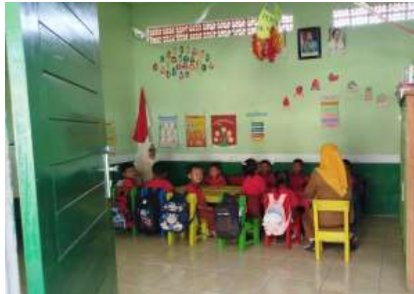
Gambar 4. Kegiatan Pembelajaran