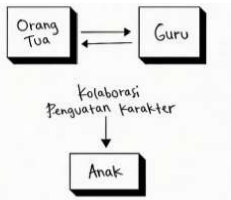
Gambar 1. Ilustrasi Analisis Penguatan Karakter

Ketidaksinkronan antara lingkungan sekolah dan rumah ini berdampak serius pada internalisasi nilai karakter anak. Ketika manajemen nilai di sekolah tidak diikuti dengan praktik yang konsisten di rumah, anak akan mengalami kebingungan kognitif dan perilaku (Amalia & Nurbaiti, 2022). Studi terbaru dari Yıldırım (2023) dalam jurnal Children and Youth Services Review menyoroti bahwa ketidakhadiran penguatan nilai di rumah dapat membatalkan kemajuan perilaku prososial yang telah dibangun di sekolah. Sebagai contoh, kebiasaan mandiri yang diajarkan guru sering kali runtuh ketika anak kembali ke rumah yang tidak menerapkan aturan serupa, menciptakan standar ganda yang menghambat pembentukan karakter yang kokoh.