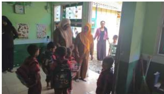
Gambar 5. Contoh Kegiatan Penguatan Karakter

Implementasi penguatan karakter di kedua lembaga dilaksanakan melalui pendekatan pembiasaan ( habituation ) dan keteladanan ( modeling ) yang terintegrasi dalam aktivitas sehari-hari. Observasi lapangan menunjukkan adanya rutinitas harian yang konsisten, di mana anak dibiasakan untuk berbaris rapi (antre) sebelum masuk kelas, melakukan doa bersama, membiasakan salam kepada guru dan teman, serta menjaga kebersihan diri melalui cuci tangan. Selain pembiasaan rutin, penguatan karakter juga dilakukan melalui keteladanan guru. Dalam hal ini, guru secara konsisten memosisikan diri sebagai model visual bagi anak dengan menunjukkan perilaku disiplin waktu, menggunakan bahasa yang sopan, serta berpakaian rapi. Konsistensi antara pembiasaan aktivitas dan keteladanan guru inilah yang menjadi fondasi utama dalam internalisasi nilai-nilai karakter pada peserta didik.