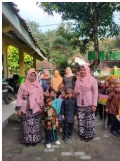
Gambar 3. Kolaborasi Guru dengan Orang Tua dalam Kegiatan Tahunan

Berdasarkan hasil observasi dan wawancara mendalam, mekanisme kolaborasi antara guru dan orang tua di kedua lembaga PAUD terjalin secara dinamis melalui komunikasi dua arah dan melibatkan aktif yang terstruktur. Secara teknis, kolaborasi ini termanifestasi dalam bentuk komunikasi harian yang bersifat insidental saat pengantaran dan penjemputan anak, di mana guru menyampaikan perkembangan emosional dan fisik anak secara langsung. Selain itu, pemanfaatan teknologi melalui grup WhatsApp menjadi media vital untuk penyampaian informasi real-time , berbagi dokumentasi kegiatan, serta instruksi tugas yang memerlukan pendampingan di rumah. Di sisi lain, sekolah juga memfasilitasi pertemuan formal terjadwal seperti rapat komite, kelas parenting , dan konsultasi perkembangan anak setiap semester. Sinergi ini semakin diperkuat dengan partisipasi aktif orang tua dalam berbagai kegiatan sekolah, mulai dari acara keagamaan, pentas seni, hingga proyek kelas, yang menunjukkan integrasi peran antara rumah dan sekolah. Temuan visual mengenai kegiatan kolaboratif ini dapat dilihat pada Gambar 3 .