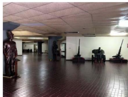
(Sumber dokumen Hafiza Aji Yoga : 2016 ruang museum@gambar kiri dan halaman belakang@gambar kanan)

pasukan M tetap terkenag dan diketahui oleh generasi penerus bangsa.