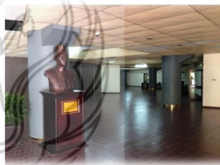
(Sumber dokumen Hafiza Aji Yoga : 2016 halaman depan@gambar kiri dan sirkulasi ruang@gambar kanan)