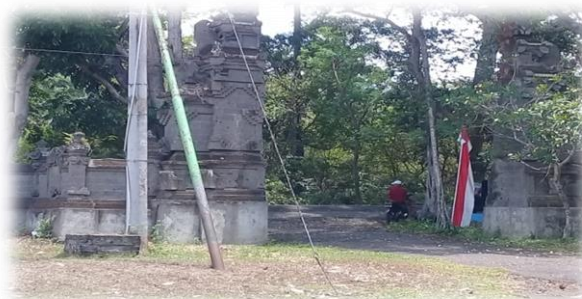
(Gerbang Masuk Monumen Operasi Lintas Laut Jawa – Bali Tahun 2018 )