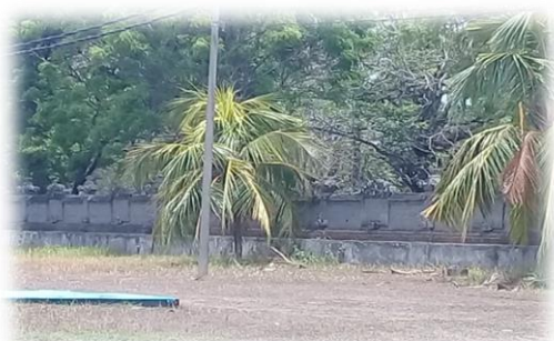
(Sumber Dokumentasi Pribadi Kondisi Halaman Depan dan Pagar Monumen Operasi Lintas Laut Jawa – Bali Tahun 2018 )