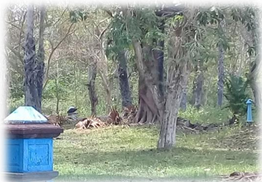
( Kondisi Halaman Samping Monumen Operasi Linta Laut Jawa – Bali tahun 2018 )