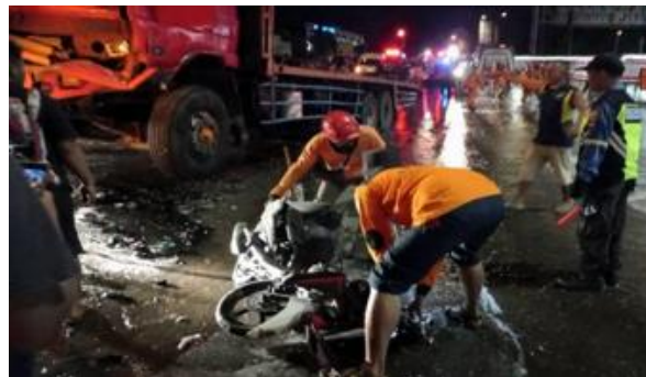
Gambar 3 : Kecelakaan Maut di Wilayah Jalan tol Banjarmasin Selatan