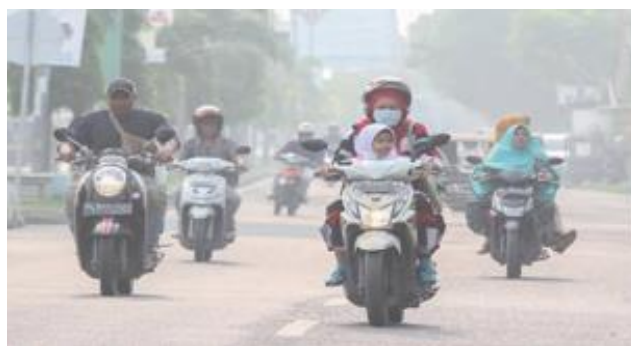
Gambar 1 : Polusi Asap Angkutan Darat di Banjarmasin Selatan Tahun, 2022