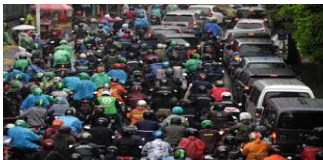
Gambar 2: Kemacetan di Wilayah Kecamatan Banjarmasin Selatan

Kemacetan menurut Kecamatan Banjarmasin Selatan, Firdaus adalah suatu yang sangat dikhawatirkan oleh masyarakat di wilayah Kecamatan Banjarmasin Selatan bahkan pemerintah karena dengan adanya kemacetan, dapat menurunkan kinerja. Bahkan dapat merugikan perusahaan sampai milyaran rupiah yang akan berdampak pada devisa negara yang akan menurun. Pertumbuhan kendaraan bermotor yang cepat di di wilayah Kecamatan Banjarmasin Selatan, tanpa diimbangi dengan pembangunan sarana dan prasarana yang memadai akan menimbulkan betumpuknya kendaraan di jalan sehingga mengakibatkan kemacetan.