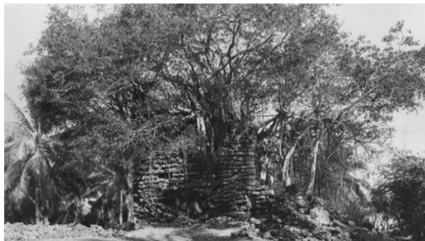
Gambar 2 : Keadaan benteng Fortoleza de Ende Minor tahun 1915

Kata “benteng” selalu identik dengan mekanisme pertahanan dan penyerangan khususnya pada masa lalu. Sesuai tujuan pembangunannya, benteng memiliki fungsi sebagai tempat perlindungan bagi mereka yang tinggal di dalamnya. Dengan banyak dan beragamnya individu yang tinggal di dalam benteng, dinamika kehidupan menjadi kompleks. Bersamaan dengan itu, benteng tidak lagi menjadi simbol pertahanan tetapi juga menjadi pusat aktivitas dan interaksi sosial manusia. Berbagai macam kegiatan dilaksanakan bukan hanya terbatas pada aktivitas peperangan atau yang berkaitan dengan militer, melainkan juga dengan cabang kehidupan manusia lainnya termasuk aspek ekonomi dan budaya. Hal ini mempengaruhi benteng yang bukan lagi melambangkan institusi militer dan peperangan melainkan menjadi pusat kehidupan sosial dan akhirnya berkembang menjadi pusat administrasi dan pemerintahan (Merillees, 2000:22).