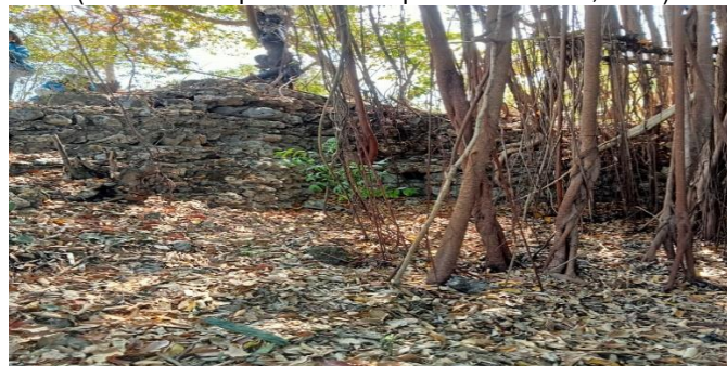
Gambar 3 : sebagian reruntuhan keadaan benteng saat ini