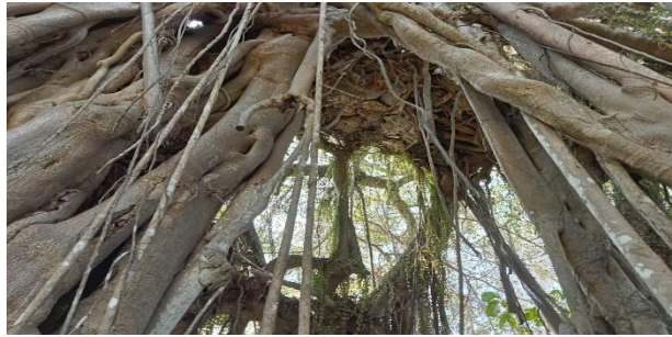
Gambar 4 : kondisi sisa tembok bagian atas benteng (sumber : dokumentasi penelitian, 2023)