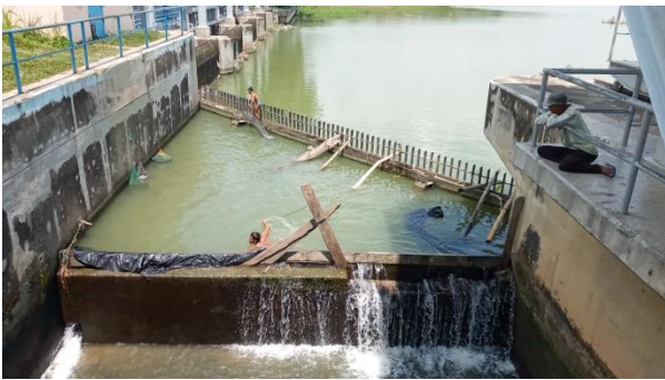
Gambar 4. Aktivitas Penangkapan Di Area Tangga Ikan

nelayan dalam melakukan aktivitas penangkapan tidak mengenal pembatasan area tangkap, bahkan termasuk area tangga ikan. Setiap nelayan berhak menangkap di area mana saja dan melakukan aktivitas penangkapan yang menurut mereka efektif dan berpotensi mendapatkan hasil yang besar. Menurut mereka, tidak ada larangan atau batasan bagi siapa pun untuk memanfaatkan daerah penangkapan.