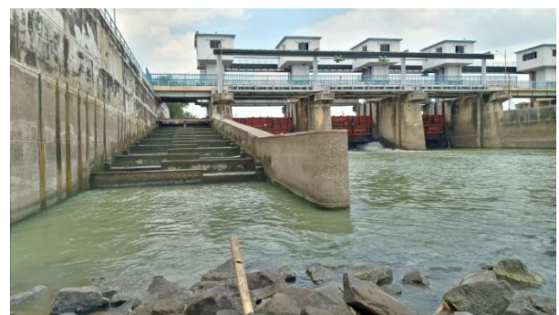
Gambar 2. Tangga Ikan Bendung Perjaya yang Berada Di Sisi Kiri Bendung

Bangunan utama Bendung Perjaya dibangun tegak lurus melintang Sungai Komerling sepanjang 215,5 m. Bangunan tangga ikan terletak di sisi bagian timur bending (Nizar et al. 2014).