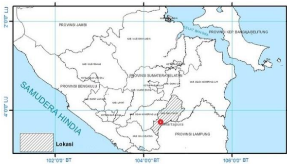
Gambar 1. Lokasi penelitian di Bendung Perjaya, Martapura

Data yang digunakan dalam penelitian ini yaitu data primer dan data sekunder. Data primer diperoleh secara langsung dari responden melalui wawancara dan observasi di lapangan. Pemilihan responden secara purposive sampling , yaitu responden dipilih dengan pertimbangan tertentu (Sugiyono, 2017). Data responden berjumlah 30 orang, terdiri dari nelayan, tokoh masyarakat, petugas Bendung Perjaya, dan pegawai Dinas Perikanan OKUT. Sedangkan data sekunder diperoleh dari studi literatur dan data dari instansi yang terkait dengan penelitian. (Moleong, 2013).