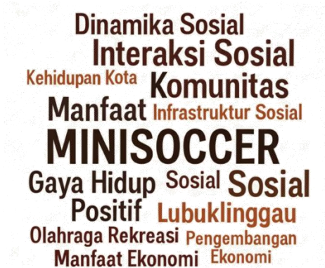
Gambar 5. Word Cloud Kata yang Sering Muncul dari Data

Secara keseluruhan, demam minisoccer di Lubuklinggau mencerminkan wajah baru masyarakat yang sehat, dinamis, dan terbuka terhadap perubahan. Ia mempertemukan berbagai generasi dalam satu wadah yang sama, menghadirkan interaksi sosial yang positif, menggerakkan ekonomi lokal, dan menumbuhkan kesadaran hidup sehat. Alnaim et al. (2025) menjelaskan bahwa interaksi sosial yang terjadi dalam kegiatan rekreasi dapat memperkuat ikatan sosial di dalam komunitas. Fenomena ini menunjukkan bahwa olahraga tidak lagi berdiri di luar kehidupan sosial, tetapi telah menjadi bagian penting dari kebudayaan masyarakat modern.