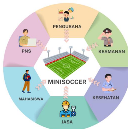
Gambar 1. Partisipan Trend Minisoccer

Sumber data dalam penelitian ini terdiri dari data primer dan data sekunder. Data primer diperoleh dari hasil observasi lapangan dan wawancara mendalam. Knott et al. (2022) menyatakan bahwa wawancara mendalam merupakan metode yang sangat efektif untuk memahami makna sosial dan pengalaman subyektif informan. Sedangkan data sekunder berasal dari dokumentasi, literatur, artikel, serta referensi lain yang mendukung analisis fenomena sosial olahraga minisoccer . Data sekunder sangat penting untuk memberikan konteks lebih luas dan mendalam terhadap fenomena yang sedang diteliti. Data sekunder memungkinkan peneliti untuk membandingkan temuan penelitian dengan kajian sebelumnya, serta menambah kedalaman analisis fenomena sosial yang sedang diteliti (Becker, 2024).