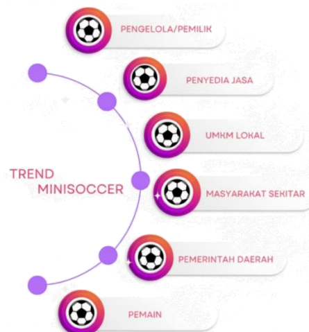
Gambar 2. Pihak Terlibat Fenomenologi Minisoccer

Untuk menjaga keabsahan data, peneliti menerapkan teknik triangulasi sumber dan metode, dengan cara membandingkan hasil wawancara dengan hasil observasi dan data dokumentasi yang diperoleh di lapangan. Teknik triangulasi sumber adalah pendekatan yang digunakan dalam penelitian kualitatif untuk meningkatkan validitas dan reliabilitas temuan dengan membandingkan data yang diperoleh dari berbagai sumber atau menggunakan berbagai metode. Tujuannya adalah untuk mendapatkan gambaran yang lebih lengkap dan objektif mengenai fenomena yang diteliti. Langkah ini dilakukan agar hasil penelitian memiliki tingkat kepercayaan dan validitas yang tinggi (Lemon & Hayes, 2020). Selain itu, dalam pelaksanaan penelitian, peneliti juga memperhatikan aspek etika penelitian dengan menjaga kerahasiaan identitas informan, bersikap objektif dalam proses pengumpulan dan analisis data, serta menggunakan seluruh informasi hanya untuk kepentingan ilmiah dan akademik.