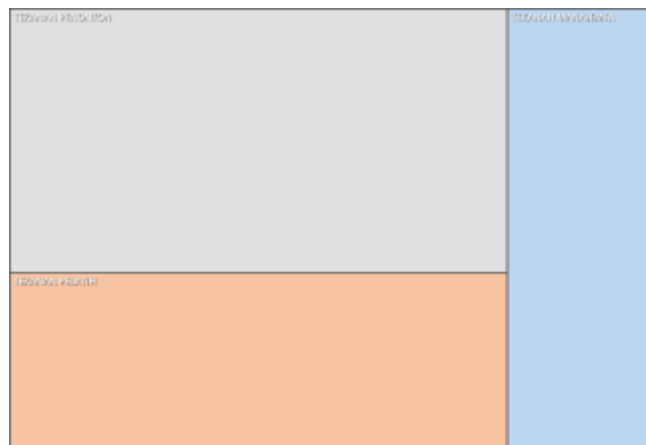
Gambar 3. Diagram Hierarkis Tree Map Faktor penyebab kecemasan.

sulit tidur serta presentase setiap indikatornya hasil dari Chart mengenai presentase kecemasan diantaranya, responden 1 memiliki presentase sering buang air kecil 19,91%, sulit berkonsentrasi 29,24%, responden 2 memiliki presentase sering buang air kecil 12,32%, sulit berkonsentrasi 26,35%, dan sulit tidur 22,56%, responden 3 memiliki presentase sering buang air kecil 06,40%, sulit berkonsentrasi 12,27%, dan sulit tidur 31,58%, responden 4 memiliki presentase sering buang air kecil 30,57%, sulit berkonsentrasi 15,00%, dan sulit tidur 30,83%, responden 5 memiliki presentase sering buang air kecil 30,81%, sulit berkonsentrasi 19,13%, dan sulit tidur 15,04%.