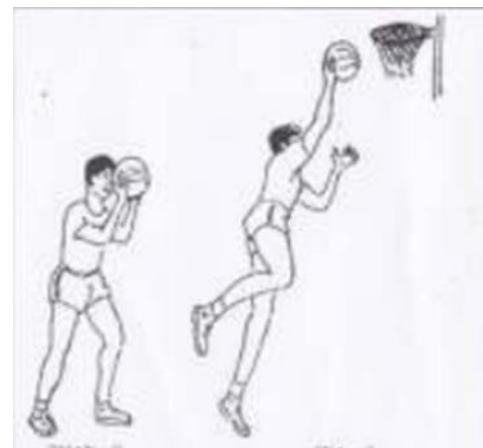
Gambar 1. Posisi Lay-up (Devita, 2013)

sampai 11 tahun. Populasi yang digunakan dalam penelitian ini adalah siswa sekolah dasar negeri 10 Anjungan yang berusia 9 hingga 11 tahun. Seluruh populasi dijadikan sampel dalam penelitian ini. Jumlah sampel dalam penelitian ini adalah 127 dengan rincian 31 anak usia 9 tahun, 41 anak usia 10 tahun dan 55 usia 11 tahun. Tes lay up dilakukan dengan prosedur siswa melakukan uji coba berdasarkan contoh sampai 3 kali percobaan, setelah itu melakukan layup pengambilan capaian berapa kali masuk dalam 5 kali kesempatan. Hasil tes lay up kemudian dilaporkan dalam ukuran tendensi sentral statistik deskriptif. Analisis dilakukan secara statistik deskriptif dan uji beda dengan menggunakan bantuan IBMSPSS 22 dan excel.