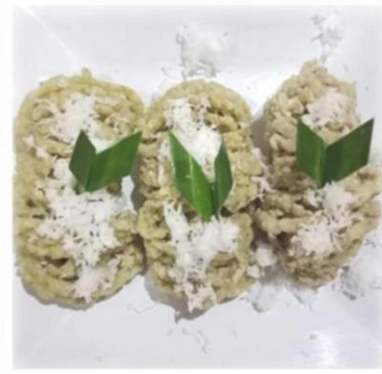
Gambar 2. Getuk Tinggi Protein Bercitarasa Rempah disajikan dengan Topping