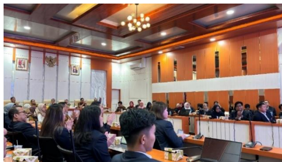
Gambar 4. Tim Dosen dan Mahasiswa melakukan Forum Group Discussion untuk mempresentasikan hasil pengabdian dan peta tematik yang telah disusun di hadapan pemerintah daerah dan stakeholder

Tahap akhir dari PKM yaitu penyelenggaraan Forum Group Discussion (FGD), di mana mahasiswa mempresentasikan hasil pengabdian mereka di hadapan pemerintah daerah dan stakeholder terkait. Forum ini memberikan platform yang efektif untuk mendiskusikan temuan pengabdian, memberikan umpan balik, serta menyusun rencana aksi bersama. Diskusi yang konstruktif selama FGD memungkinkan semua pihak untuk mengevaluasi hasil pengabdian secara mendalam dan mendiskusikan tantangan serta solusi yang mungkin timbul dalam implementasi rekomendasi yang diberikan. Tahap terakhir adalah penyusunan laporan akhir yang mencakup rumusan hasil pengabdian, peta tematik, serta rekomendasi strategis untuk pengembangan potensi pariwisata di Kabupaten Ogan Ilir. Laporan ini disusun berdasarkan data yang diperoleh dari survey lapangan, analisis data, dan umpan balik dari FGD, dan diharapkan dapat memberikan panduan yang jelas dan terperinci untuk pemerintah daerah dalam merancang dan melaksanakan strategi pengembangan pariwisata yang berkelanjutan dan efektif.