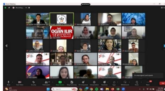
Gambar 1. Pertemuan antara tim PKM, yang terdiri dari dosen dan mahasiswa, dengan pemerintah daerah Kabupaten Ogan Ilir melalui zoom meeting

Hasil dari pengabdian kepada masyarakat (PKM) yang dilaksanakan melalui Field Research di Kabupaten Ogan Ilir menunjukkan kemajuan yang sangat signifikan dalam hal identifikasi dan pengembangan potensi pariwisata di wilayah ini. Melalui serangkaian kegiatan yang telah direncanakan dan dilaksanakan secara sistematis, telah ditemukan berbagai potensi wisata yang dapat menjadi daya tarik utama bagi pengembangan pariwisata di Kabupaten Ogan Ilir. Pada tahap awal, pertemuan antara tim peneliti dari Institut Pariwisata Trisakti dan pemerintah daerah Kabupaten Ogan Ilir bertujuan untuk menyepakati tujuan pengabdian, ruang lingkup kegiatan, serta jadwal pelaksanaan. Diskusi yang mendalam ini mencakup harapan dan kebutuhan pemerintah daerah terkait pengembangan pariwisata, serta pengaturan koordinasi antara berbagai pihak yang terlibat dalam proyek ini. Hal ini menciptakan pemahaman yang sama di antara semua pihak mengenai tujuan dan proses pengabdian, serta memastikan bahwa semua langkah yang diambil sesuai dengan harapan dan kebutuhan daerah