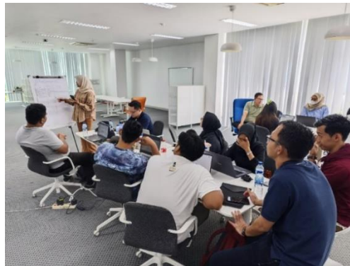
Gambar 3. Tim Dosen dan Mahasiswa Program Magister Pariwisata berdiskusi untuk menganalisis hasil data temuan di masing-masing Kecamatan di Kabupaten Ogan Ilir, Provinsi Sumatera Selatan

Tahap akhir dari PKM yaitu penyelenggaraan Forum Group Discussion (FGD), di mana mahasiswa mempresentasikan hasil pengabdian mereka di hadapan pemerintah daerah dan stakeholder terkait. Forum ini memberikan platform yang efektif untuk mendiskusikan temuan pengabdian, memberikan umpan balik, serta menyusun rencana aksi bersama. Diskusi yang konstruktif selama FGD memungkinkan semua pihak untuk mengevaluasi hasil pengabdian secara mendalam dan mendiskusikan tantangan serta solusi yang mungkin timbul dalam implementasi rekomendasi yang diberikan. Tahap terakhir adalah penyusunan laporan akhir yang mencakup rumusan hasil pengabdian, peta tematik, serta rekomendasi strategis untuk pengembangan potensi pariwisata di Kabupaten Ogan Ilir. Laporan ini disusun berdasarkan data yang diperoleh dari survey lapangan, analisis data, dan umpan balik dari FGD, dan diharapkan dapat memberikan panduan yang jelas dan terperinci untuk pemerintah daerah dalam merancang dan melaksanakan strategi pengembangan pariwisata yang berkelanjutan dan efektif.