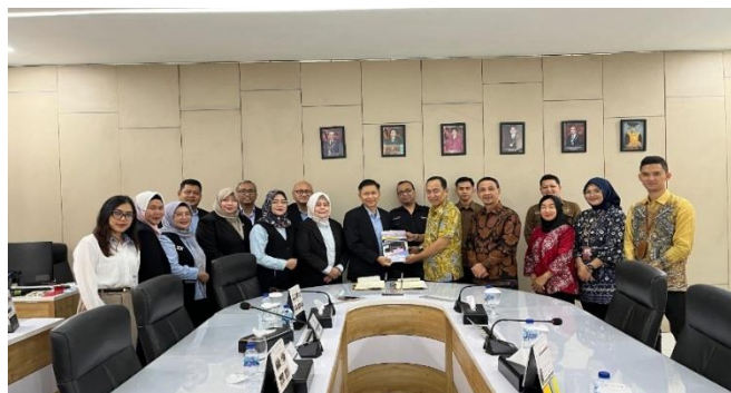
Gambar 5. Dokumentasi Penandatanganan MoU dan Serah Terima Laporan Akhir Pengabdian PKM di Kabupaten Ogan Ilir

Sebagai bagian dari kegiatan ini, diadakan penandatanganan Nota Kesepahaman (MoU) antara Institut Pariwisata Trisakti dan Pemerintah Kabupaten Ogan Ilir yang dilakukan di Ruang Rapat Utama Institut Pariwisata Trisakti. Acara ini dihadiri oleh jajaran pemerintah Ogan Ilir dan pihak-pihak terkait dari Institut Pariwisata Trisakti. Penandatanganan MoU ini bertujuan untuk memperkuat kerjasama antara kedua belah pihak dalam pengembangan pariwisata di Kabupaten Ogan Ilir. Selanjutnya, laporan akhir dari pengabdian diserahkan kepada Pemerintah Kabupaten Ogan Ilir sebagai bagian dari hasil pengabdian masyarakat. Laporan akhir tersebut akan mencakup temuan pengabdian, rekomendasi pengembangan pariwisata, dan rencana aksi untuk implementasi hasil pengabdian. Dengan adanya MoU dan laporan akhir ini, diharapkan dapat terbentuk sinergi yang lebih kuat dalam upaya memajukan pariwisata Kabupaten Ogan Ilir dan memberikan dampak yang signifikan bagi kemajuan daerah serta kesejahteraan masyarakat setempat.