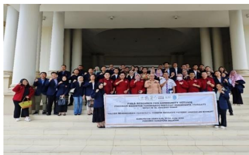
Gambar 2. Foto bersama sebelum kegiatan observasi di depan kantor Bupati Ogan Ilir bersama dosen, mahasiswa, dan pemerintah Kabupaten Ogan Ilir

kecamatan yang telah ditetapkan untuk memastikan cakupan yang menyeluruh dan mendalam. Selama proses survey, data dikumpulkan melalui wawancara mendalam dengan berbagai pihak terkait, serta dokumentasi foto dan video yang membantu memberikan gambaran yang lebih komprehensif mengenai potensi wisata di setiap kecamatan. Catatan lapangan juga diambil untuk mencatat informasi penting yang mungkin tidak tertangkap melalui wawancara atau dokumentasi visual. Proses ini bertujuan untuk memperoleh informasi yang mendalam mengenai kondisi sosial, ekonomi, dan budaya lokal yang relevan dengan potensi pengembangan pariwisata, sehingga memungkinkan identifikasi dan pemanfaatan potensi yang ada dengan lebih efektif.