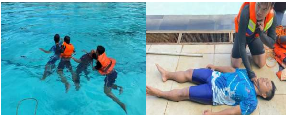
Gambar 2. Dokumentasi Kegiatan Pengabdian Masyarakat

Kegiatan dilaksanakan dua sesi. Sesi teori dan sesi praktek. Kegiatan diikuti oleh guru pendidikan jasmani Se Kecamatan Gunungpati. Kegiatan ini berlangsung lancar dan peserta aktif. Kegiatan dilaksanakan di kolam renang Universitas Negeri Semarang.