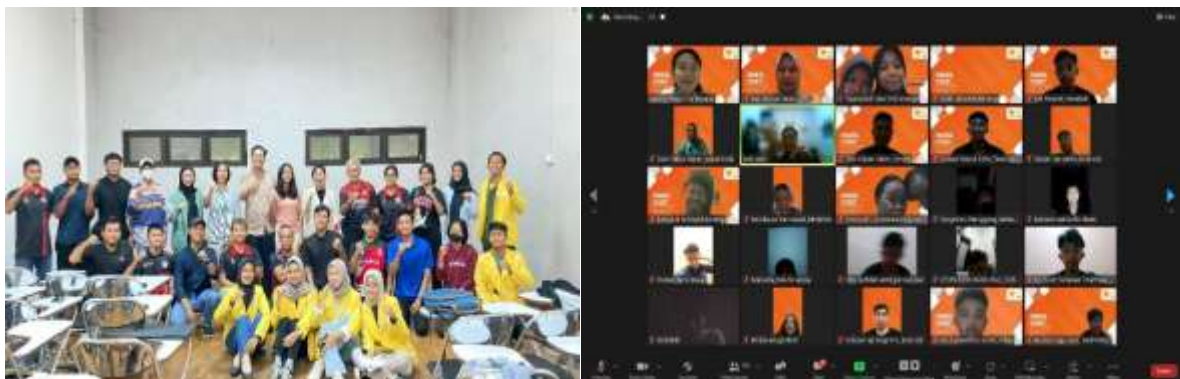
Gambar 1. Dokumentasi Kegiatan Pengabdian Masyarakat

Kegiatan pengabdian Masyarakat diikuti ±50 cabang olahraga yang berasal dari patriot olahraga Kota Semarang. Atlet dan pelatih mendapatkan edukasi dengan intensif selama 16 jam tatapmuka dan dilanjutkan dengan pendampingan selama 60 jam.