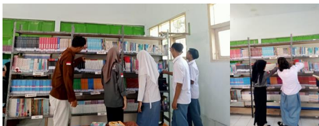
Gambar 1. Pemilihan Buku di Perpustakaan

Target pembuatan Pojok Baca di SMKS Nusantara Banyuwangi adalah pada kelas 10 dan 11.