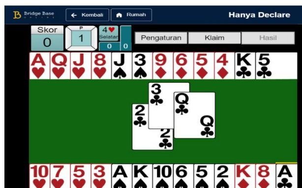
Gambar 2. Praktek Permainan BBO