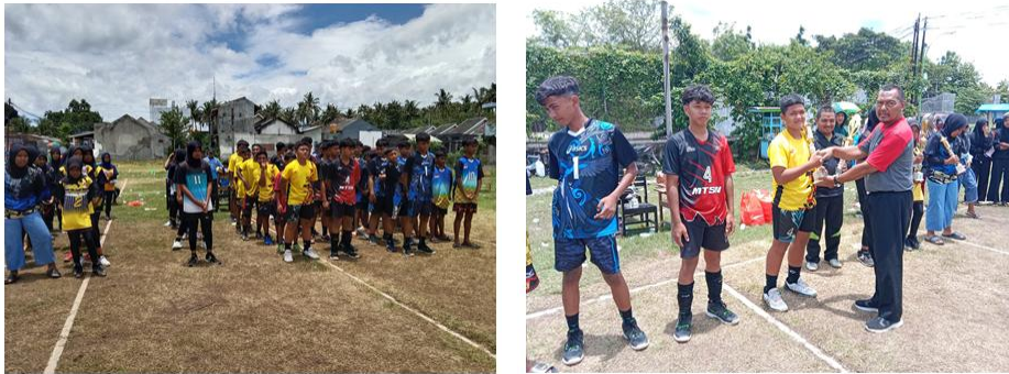
Gambar 2. Upacara dan Pembagian Hadiah Oleh Bapak Koordinator.

Dari tabel diatas dapat diketahui bahwa untuk tim putra juara 1 diraih oleh tim KKM 01, juara 2 diraih oleh tim MTsN 02, kemudian juara 3 bersama diraih oleh tim MTsN 06 dan MTsN 11. Untuk tim putri juara 1 diraih oleh tim KKM 04, juara 2 diraih oleh tim MTsN 06, kemudian juara 3 bersama diraih oleh tim KKM 02 dan MTsN 11.