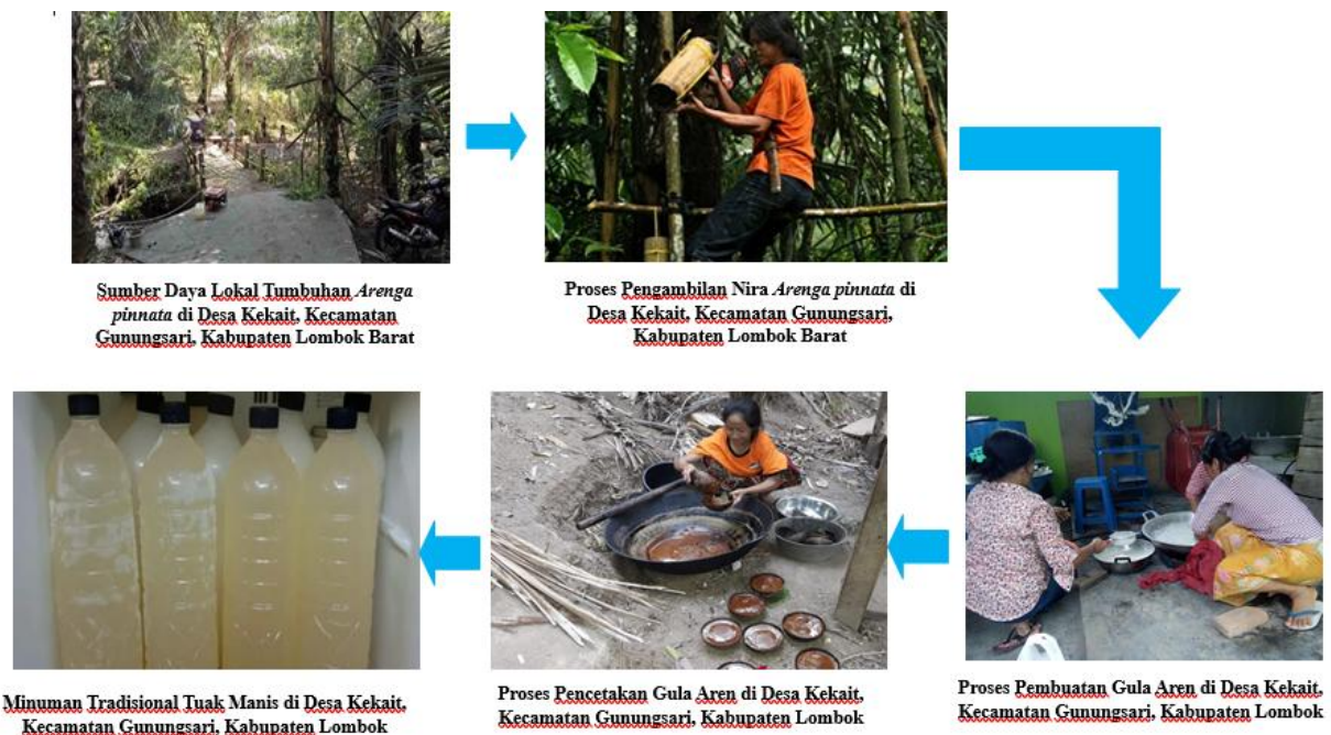
Gambar 1. Analisis Situasi Kondisi Mitra

Tenggara Barat. Tingkat pengetahuan literasi keuangan digital pada petani gula aren ( Arenga pinnata ) yang merupakan sumber daya hayati lokal di Desa Kekait pada umumnya yang menjadi mitra pengabdian kepada masyarakat masih perlu penguatan. Berdasarkan hal tersebut maka perlu dilakukan kegiatan pengabdian masyarakat berupa penguatan literasi keuangan digital bagi petani gula aren di Desa Kekait, Kecamatan Gunungsari, Kabupaten Lombok Barat.