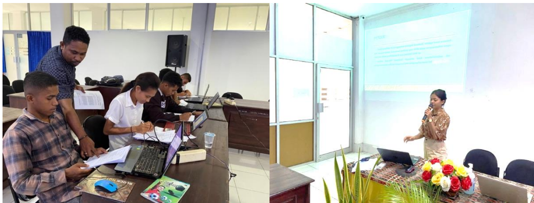
Gambar 2. Dosen mendampingi penyusunan slide dan oral presentasi peserta

Setelah menutup sesi kelompok, selanjutnya memfasilitasi masing-masing peserta melakukan presentasi oral di depan semua peserta. Berbeda dengan demonstrasi sebelumnya, bagian ini lebih global karena peserta melakukan presentasi oral setelah mendapatkan masukan dan pendampingan dari sejawat maupun dosen. Perbedaan lainnya juga mencolok pada penilaiannya, bila dalam kelompok dinilai oleh sejawat, namun pada sesi ini presentasi oral peserta dinilai oleh dosen yang diacak dari kelima kelompok diskusi. Misalnya dosen pendamping kelompok satu akan menilai dari peserta Kelompok 3 dan seterusnya. Upaya ini sebagai bentuk evaluasi yang objektif sekaligus untuk mengonfirmasi indeks perubahan dari kegiatan pelatihan.