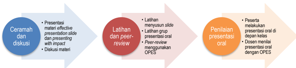
Gambar 1. Prosedur kegiatan pengabdian

Pertama, ceramah dan diskusi difasilitasi oleh Isak Riwu Rohi, S.Pd., M.Pd. (materi " Effective presentation slides ") dan Jusuf Blegur, S.Pd., M.Pd. (materi " Presenting with impact "). Kedua, latihan penyusunan slide presentasi dan melakukan presentasi oral oleh setiap peserta di kelompoknya masing-masing yang dibimbing oleh satu dosen pendamping. Peserta menyusun materi dari artikel publikasi ilmiah (jurnal ilmiah) dan melakukan oral presentasi di dalam masing-masing kelompok (5 menit). Oral presentasi dinilai oleh sejawatnya menggunakan Oral Presentation Evaluation Scale (OPES) yang diadopsi dari Chiang et al. (2022). Hasil peer-review diikuti dengan tindakan refleksi diri dan tindak lanjut perbaikan terhadap aspek-aspek presentasi oral yang masih bermasalah. Dosen pendamping, fasilitator, dan sejawatnya mahasiswa juga berdiskusi untuk memperbaiki masalah slide maupun keterampilan presentasi oral peserta. Terakhir, setelah sesi perbaikan dalam tiap kelompok selesai, maka peserta berkesempatan melakukan presentasi oral kepada semua peserta pelatihan (termasuk fasilitator, tim dosen pendamping, dan sejawatnya) untuk dinilai. Selama sesi ini, hasil presentasi oral peserta dinilai oleh fasilitator dan tim dosen menggunakan OPES dan diikuti dengan evaluasi bersama untuk melihat indeks perubahannya.