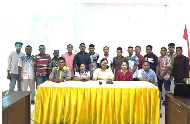
Gambar 4. Foto Bersama Wakil Dekan III, Fasilitator, Panitia, Serta Perwakilan Peserta

Sebagai informasi tambahan, kegiatan pengabdian ini juga telah terpublikasi pada koran online Pena Nusantara dengan judul “Prodi PJKR Latih Mahasiswa Menyusun Skripsi sesuai Template ” ( https://www.penanusantara.com/prodi-pjkr-ukaw-latih-mahasiswa-menyusun-skripsi-sesuai-template/?fbclid=IwAR2laNp3F9zHDUDEnjEbdTzmqohSAWYrX87NrlyGb2cq5QLBKs5poaeyfYw ).