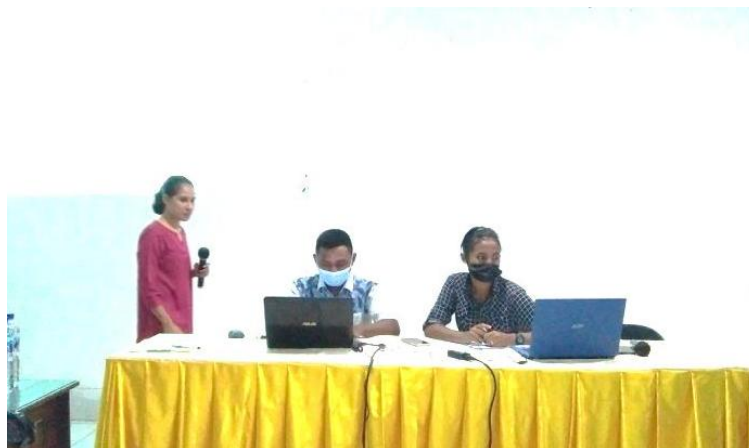
Gambar 2. Pnatmo Memandu Peserta Menyimulasi Pencarian Referensi Melalui Google Scholar

Penting bagi mahasiswa untuk menggunakan referensi yang kredibel agar saat menyusun sitasi, mereka dapat mempertanggungjawabkan secara akademik maupun secara moral. Karena ini adalah upaya dasar untuk menghindari mahasiswa dari berbagai praktik pelanggaran etika akademik. Referensi yang kredibel juga menunjukkan proses penelitian hingga pada publikasi dilewati dengan mekanisme ilmiah yang ketat. Jadi saat mahasiswa mengajukan sebagai sebagai sitasi, mampu menekan berbagai bias akademik yang muncul. Setidaknya dasar mereka mengambil keputusan atau simpulan untuk arah penelitian masa depan atau strategi penyelesaian masalah tepat guna.