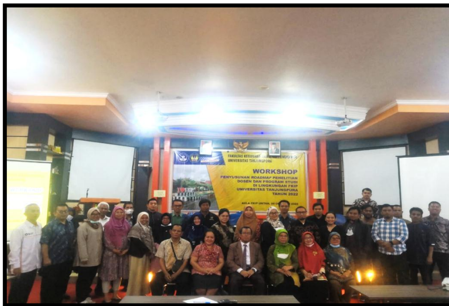
Gambar 2. Kegiatan PKM Workshop Penyusunan Roadmap Penelitian Dosen dan Program Studi di Lingkungan FKIP Universitas Tanjungpura