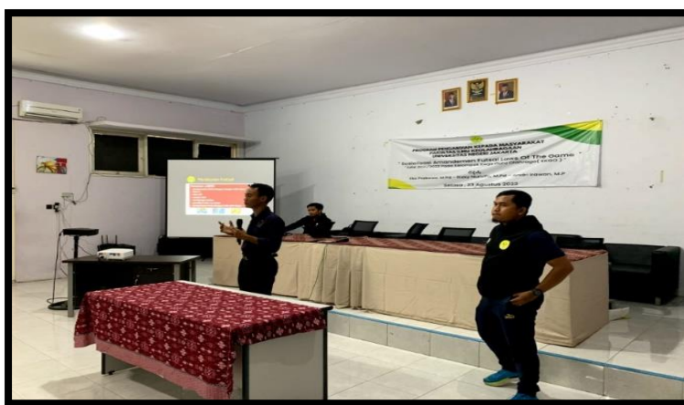
Gambar 3. Penyampaian Materi oleh Mahasiswa

Lalu berikutnya adalah tendangan pinalti baik 10 meter (hasil dari akumulasi pelanggaran langsung) dan pinalti 6 meter yaitu apabila pelanggaran yang terjadi di wilayah penjaga gawang D-Area. Tendangan kedalam yang berada di sepanjang garis Panjang lapangan dan tendangan sudut berada di sudut ujung lebar lapangan. Yang berbeda dari sepakbola adalah ketika terjadi bola keluar di garis lebar penjaga gawang akan terjadi tendangan oleh penjaga gawang atau pemain, berbeda dengan di olahraga futsal, apabila hal itu terjadi maka dapat dilakukan dengan pembersihan gawang yaitu penjaga gawang memulai atau melanjutkan pertandingan setelah bola keluar dengan melempar bola menggunakan tangan dengan waktu maksimal 4 detik.