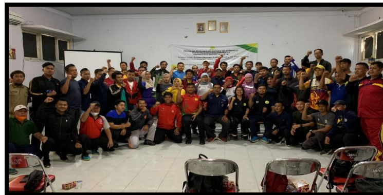
Gambar 5. Pemateri dan Peserta Kegiatan Pengabdian Kepada Masyarakat

Setelah semua materi tersampaikan, dikarenakan di awal sebelum pembukaan telah diberikan pre-tes , maka tim juga memberikan post-test kepada para peserta. Hal ini dilakukan untuk melihat sampai sejauh mana pemahaman materi yang telah disampaikan dapat diterima dengan baik atau tidak.