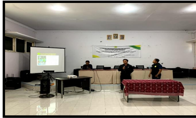
Gambar 4. Penyampaian Materi oleh Wasit Futsal

Setelah semua materi tersampaikan, dikarenakan di awal sebelum pembukaan telah diberikan pre-tes , maka tim juga memberikan post-test kepada para peserta. Hal ini dilakukan untuk melihat sampai sejauh mana pemahaman materi yang telah disampaikan dapat diterima dengan baik atau tidak.