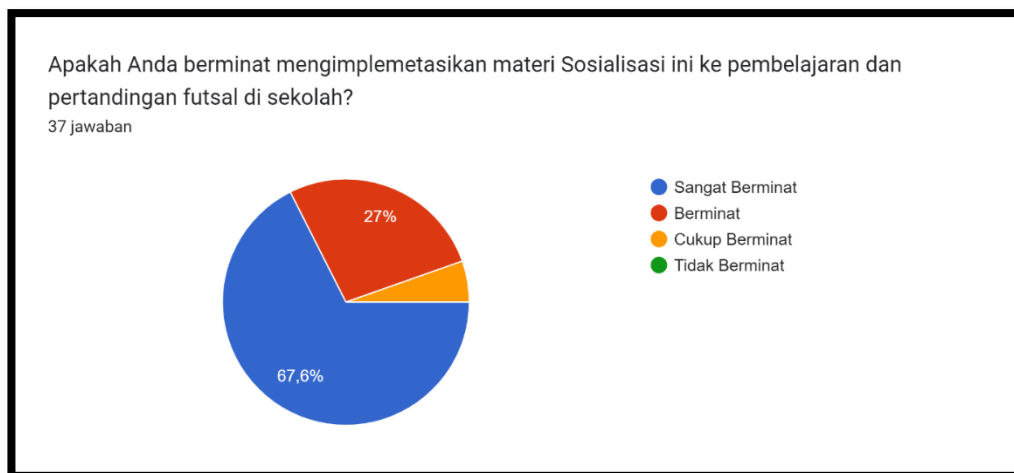
Gambar 8. Hasil Implementasi Materi ke Pembelajaran dan Pertandingan Futsal di Sekolah

Hasil di atas merupakan kebutuhan guru untuk pembelajaran dan pertandingan futsal di sekolah adalah sebanyak 21 peserta (56,8%) menyatakan sangat sesuai dengan kebutuhan guru, 14 peserta menyatakan sesuai, dan 2 peserta (5,4%) menyatakan cukup sesuai.