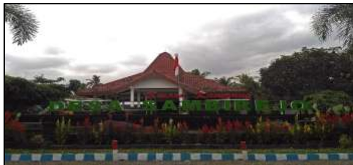
Gambar 1. Lokasi Pelaksanaan Pengabdian

membangun perekonomian warga, terlebih kepada perempuan karena melalui pengembangan pertanian, perempuan akan mampu menunjang kesejahteraan khususnya dalam lini terkecil yakni keluarga (Sobron, Titik, & Meidawati, 2020). Upaya yang dilakukan dalam model pemberdayaan masyarakat tidak terlepas dari sinergi antar pihak yang dapat mendukung keberhasilan program, hal ini sejalan dengan pernyataan (Kadek Mustika, 2018). Berdasarkan hal itu tim pelaksana pengabdian tetap berkolaborasi dengan pemerintahan desa dan jejaring lainnya yang dimiliki oleh tim pelaksana pengabdian kepada masyarakat.