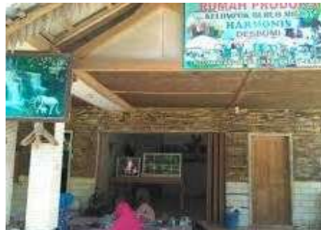
Gambar 2. Tempat Produksi Gapoktan Tri Mulyo

Namun demikian, seiring dengan meningkatnya laju buruh migran ke luar negeri yang berharap perbaikan kualitas kesejahteraan keluarga, mereka memiliki tantangan saat kembali ke kampung halaman. Rendahnya keterampilan berwirausaha dan menekuni industri rumah tangga merupakan masalah yang seringkali dihadapi perempuan purna buruh migran, sehingga potensi ekonomi belum dimanfaatkan dengan baik. Model pemberdayaan yang tepat dapat meningkatkan pengetahuan dan keterampilan sasaran dengan menghasilkan hasil yang maksimal sesuai dengan permasalahan mitra (Ginting, 2019).