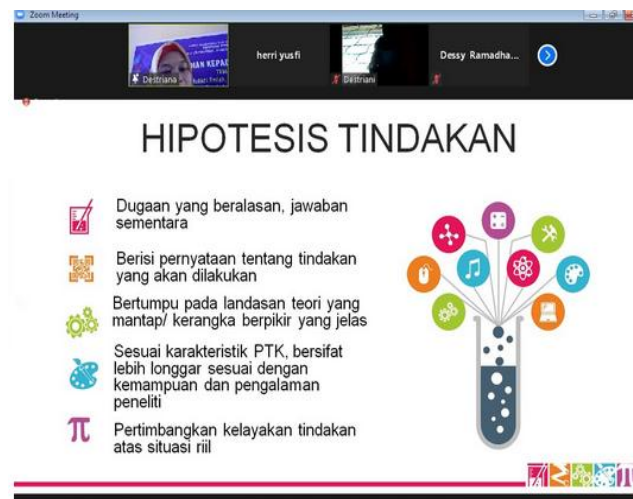
Gambar 3. Pemberian Materi PTK dan OJS

Gambar di atas adalah pelaksanaan kegiatan pendampingan yang dilakukan secara daring menggunakan aplikasi Zoom Meeting. Hasil pendampingan dapat diketahui dari hasil evaluasi dengan menggunakan angket. Untuk lebih jelasnya dapat dilihat pada Table berikut ini: berikut ini: