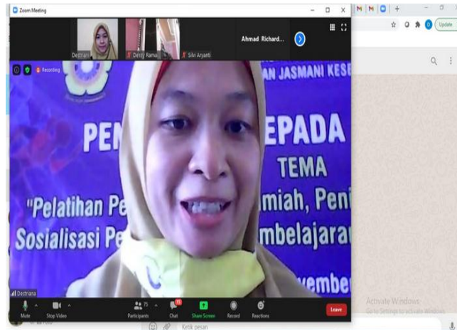
Gambar 2. Pemberian Materi PTK dan OJS