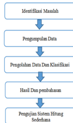
Gambar 2. Tahapan Penelitian

Tahapan atau langkah dalam penelitian dalam penerapan jaringan syaraf tiruan untuk prakiraan cuaca di wilayah Kota Blitar menggunakan metode algoritma hopfield yaitu sebagai berikut :