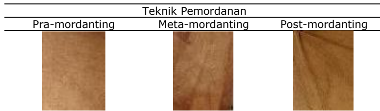
Table 2. Data Hasil Penilaian Ketajaman Warna dari Panelis pada Hasil Kain Katun dari Ekstrak Pewarnaan Kulit Kayu Tingi