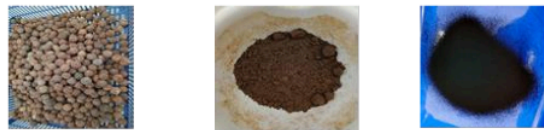
(A) (B) (C)

Setelah 24 jam, campuran dipisahkan dengan kertas saring dan dilakukan proses pencucian hingga pH netral. Langkah terakhir, biosorben dilakukan pengeringan pada suhu 110°C selama 2 jam menggunakan oven. Langkah ini ditempuh untuk mengeliminasi air yang masih terkandung pada biosorben karena semakin kecil molekul air yang terkandung dalam biosorben maka akan semakin kecil pula kemungkinan molekul lain akan masuk (Oko et al., 2021).