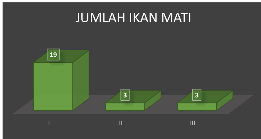
Gambar 2. Jumlah ikan mati selama perlakuan 14 hari

Jumlah ikan mati tertinggi pada kelompok I yaitu 19 ekor tanpa perlakuan senyawa kombinasi oxytetracycline, MgSO_4 \cdot 7H_2O , vitamin C, dan B kompleks, sedangkan pada kelompok II kematian ikan sejumlah 3 ekor, dan kelompok tiga dengan kombinasi ikan pernah sakit dan belum pernah sakit dengan perlakuan pemberian senyawa kombinasi sebanyak 3 ekor.