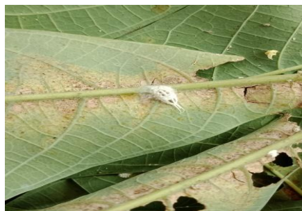
Gambar 3.1 jenis Paracoccus marginatus